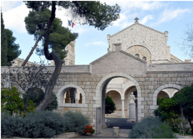
Entrée de l'école biblique et archéologique française de Jérusalem (EBAF).

à l'Académie des Inscriptions et Belles-Lettres