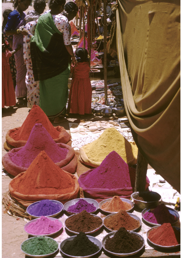
Couleurs du bon augure, marché de Mysore, sud de l'Inde

Réfléchir sur la couleur engage à recourir à toutes les sciences humaines et sociales, sans oublier les sciences de la matière ou de la nature. Réfléchir sur l'Asie, ses langues, ses littératures, ses arts, ses sociétés, ses nations, ses univers culturels ne manque pas de mettre le chercheur devant le miroitement des couleurs, le foisonnement des visions et des concepts qu'elles font proliférer. Devant la couleur on est réceptif et créateur. D'une réalité matérielle, d'une sensation rétinienne, les civilisations font une œuvre d'art, un symbole national, un insigne d'appartenance sociale, un langage. L'étude des couleurs, de leurs influences mutuelles, de leurs noms, de leurs classifications, de leurs destinations dans l'usage, est un outil puissant de caractérisation d'entités de toute nature, un poète, un artiste, un individu, une famille, un peuple. C'est toujours un révélateur d'originalité.