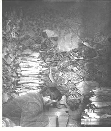
Paul Pelliot examinant des rouleaux dans la grotte aux manuscrits et aux peintures à Dunhuang. Paris, musée Guimet.

Au début de l'année 1908, Paul Pelliot arrive à Dunhuang, où il examine les dizaines de milliers de manuscrits récemment découverts dans une grotte scellée depuis neuf siècles, manuscrits qui vont transformer totalement l'histoire de la Chine médiévale et apporter des données entièrement nouvelles sur les échanges entre l'Inde, l'Asie centrale et la Chine. En dépit de certaines polémiques, l'importance des documents qui étaient rapportés à Paris se révéla telle qu'elle apporta immédiatement à Paul Pelliot la célébrité et l'accès aux plus hautes fonctions académiques. Mais la curiosité intellectuelle du savant, l'étendue de son savoir, l'assurance et la justesse de son jugement, ses formidables capacités de travail, en ont fait un homme de légende. Ouvert aux études tibétaines, turques, mongoles ou iraniennes, ainsi qu'à celles de l'Annam et du Cambodge dans ses premiers travaux, Paul Pelliot couvrit tous les domaines de la sinologie, de l'histoire aux religions, de la philologie aux arts, entretenant des contacts étroits avec ses collègues du monde entier. Il fut sans aucun doute le premier sinologue occidental à traiter d'égal avec