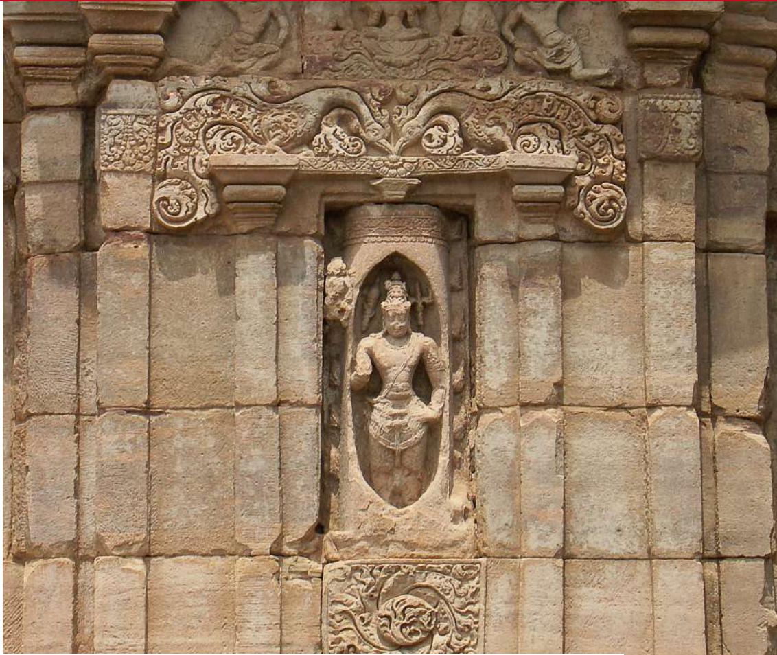
Mythe indien d'origine, Pattadakal, Lingodbhavamurti, VIII e s. CE