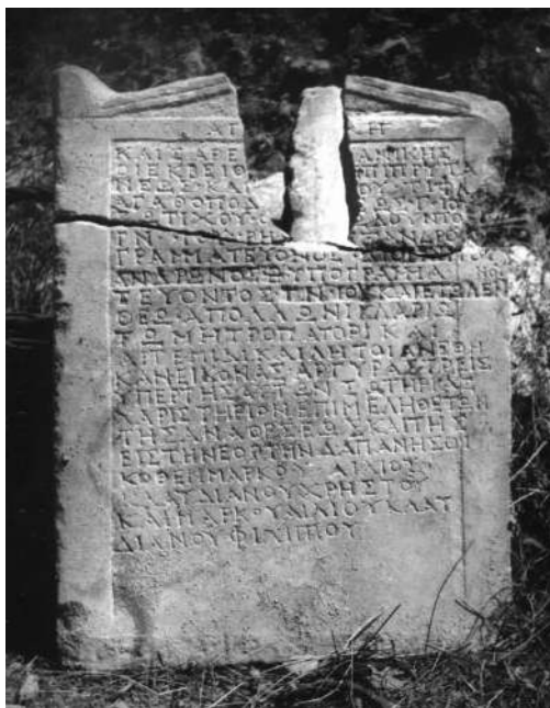
Claros, mémorial de Césarée Germanikè de Bithynie, n° 191 du corpus. Le fragment manquant a été trouvé et copié par Louis Robert.