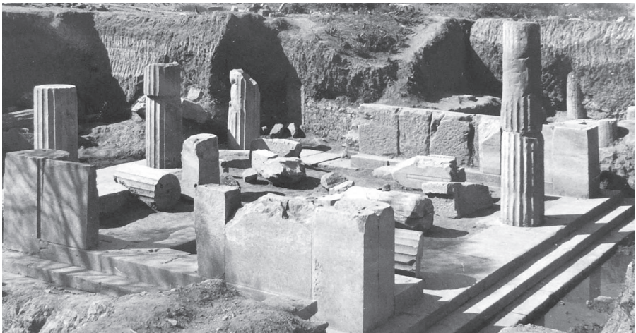
Vue d'ensemble des Propylées du site de Claros.

Jean-Louis Ferrary, Les mémoriaux de délégations du sanctuaire oraculaire de Claros, d'après la documentation conservée dans le Fonds Louis Robert (Paris, 2014, 2 vol. : ouvrage présenté dans la vitrine)