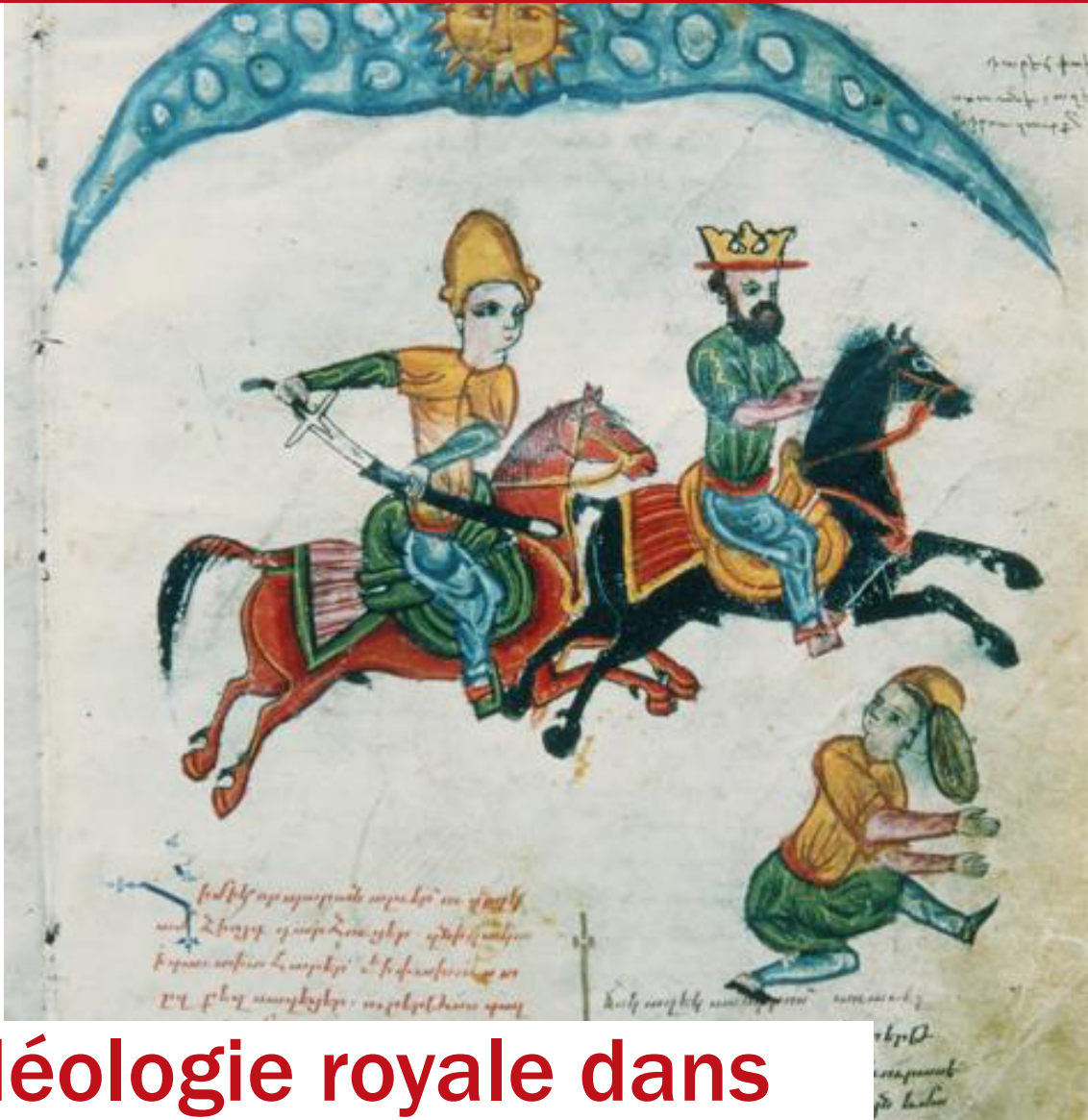
Ms Érévan (Maténadaran N° 5472, folio 83)