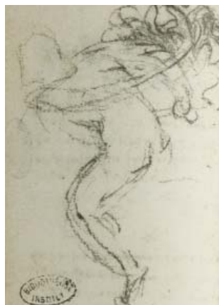
Léonard de Vinci, Manuscrit K, fol. 14 verso

Parc stationnement : Mazarine (27 rue Mazarine, 75006 Paris)