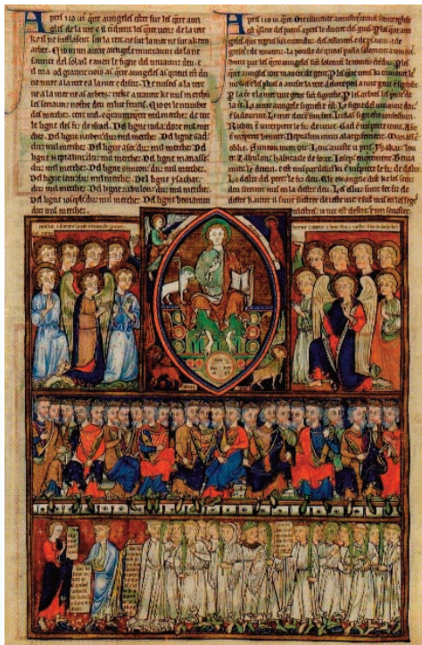
Trinity College Cambridge, MS R.16.2, f.7v : Adoration de Dieu et de l'Agneau, Explication des figures vêtues de blanc

Prises dans le feu croisé des conflits mais aussi des échanges fructueux et complexes entre la France et les Îles Britanniques au Moyen Âge, les cultures insulaires d'expression française sont un héritage commun aux nations de part et d'autre de la Manche. Du côté de la France, le philologue Paul MEYER, co-fondateur de la revue Romania et membre de l'Académie (1840-1917), l'avait bien montré : ses missions assidues dans les bibliothèques anglaises lui avaient fourni la matière de découvertes dont nous sommes toujours redevables.