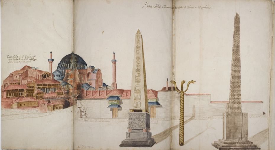
Les monuments de l'Hippodrome. Album Freshfield 1574, fol. 20.

et à l'Académie des Inscriptions et Belles-Lettres