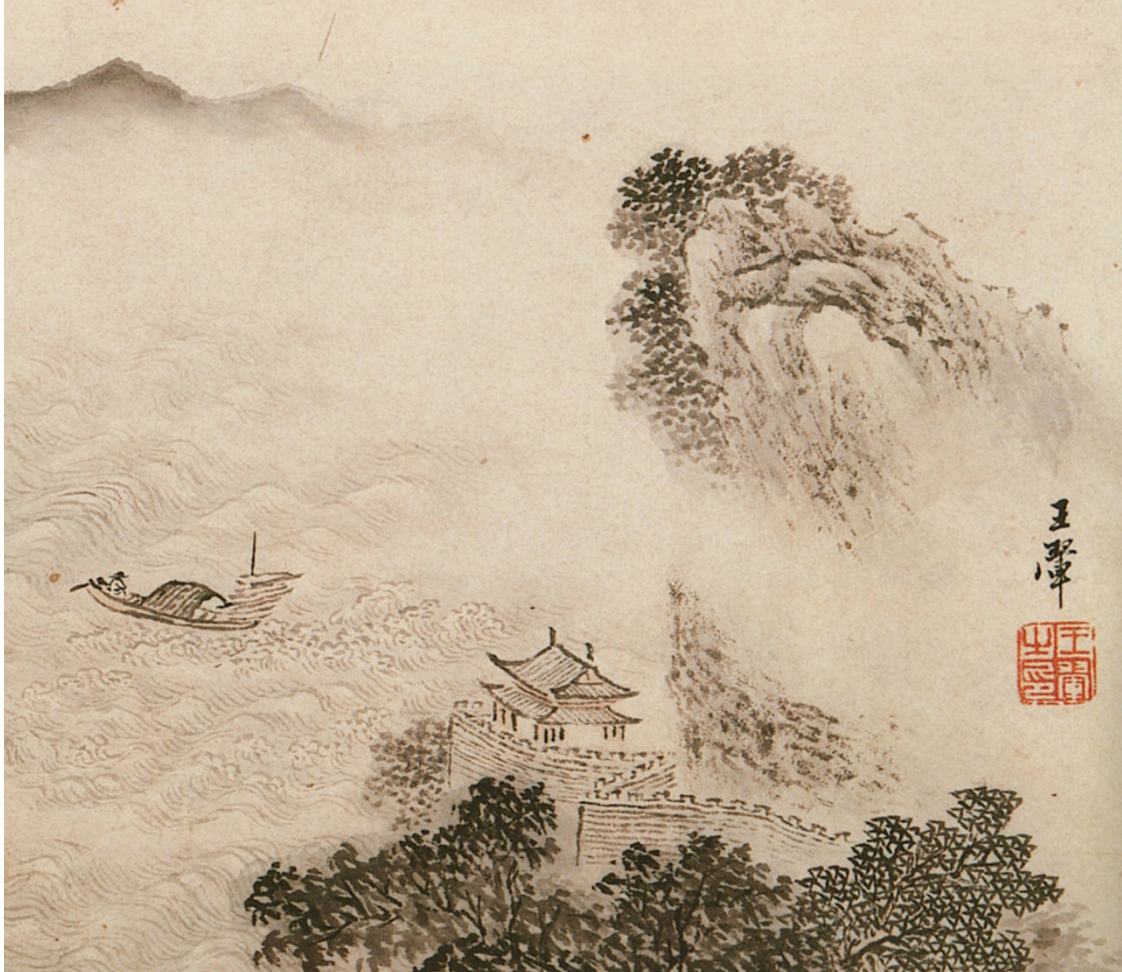
Wang Hui (1632-1717) Paysage, encre sur papier, Musée Cernuschi.

à l'INALCO et à l'Académie des Inscriptions et Belles-Lettres (AIBL)