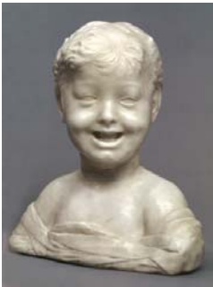
Desiderio da Settignano. Enfant riant , vers 1460-1464. Marbre. Vienne, Kunsthistorisches Museum.