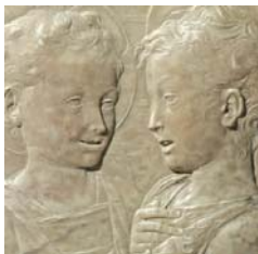
Desiderio da Settignano. Jésus et saint Jean Baptiste enfants , dit Tondo Arconati Visconti , vers 1455-1457. Musée du Louvre.

Les arts plastiques donnent une place première ou en retrait à la représentation du sourire. Ils reflètent la diversité des cultures. Le sourire est le fait de belles exceptions dans l'art occidental, omniprésent dans l'art khmer.