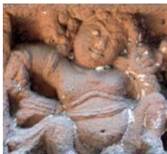
Serveur de Śiva Mahakut (Inde).