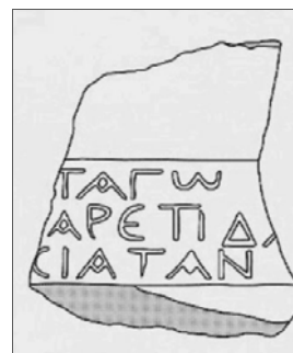
Fragment de tuile estampée en argile [« Kastraki », chap. IV. Catalogue/Éléments d'architecture/Terre cuite]