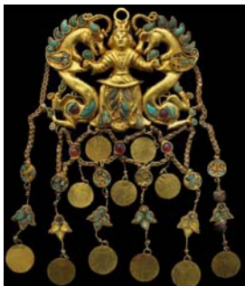
Pendeloques dites Le souverain et les dragons , I er siècle, Afghanistan – Tillia Tepe

- sous le titre « Les aventures de la nymphe de Begram », en pleine page et dans sa rubrique « International », le quotidien Le Monde (07/12, p. 3) fait écho aux six pages parues dans Le Monde 2 (le 1 er décembre) ;