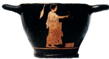
Skyphos (C 10244) d'Argilos

Les actes de ce colloque, réunissant 15 contributions, constituent le premier numéro d'une nouvelle collection de l'Académie des Inscriptions et Belles-Lettres, les Cahiers du Corpus Vasorum Antiquorum, venant en complément du CVA dont la série française compte à ce jour 40 fascicules.