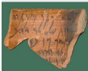
Ostracon J4, message adressé à Natan

2 vol. : Vol. 1 : 560 p. ; vol. 2 : 347 pl., déc. 2006 - Diffusion De Boccard — 11 rue de Médicis 75006 PARIS — tél. 01 43 26 00 37