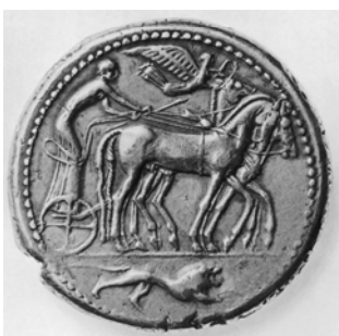
Décadrachme de Syracuse, dit « Damarétéion » (argent, vers 480-479 av. J.-C.). Quadriga au pas ; Victoire ailée.