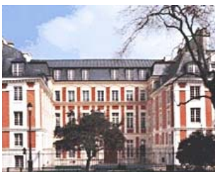
Institut historique allemand (IHA) Hôtel Duret de Chevry (Paris 3 e )