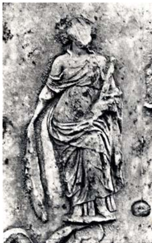
Vénus sur la statue cuirassée de Chercell (d'après P. Gauckler, Musée de Chercell, Paris 1895, pl.12,2)