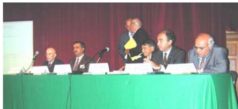
Séance inaugurale des Journées AOURAS