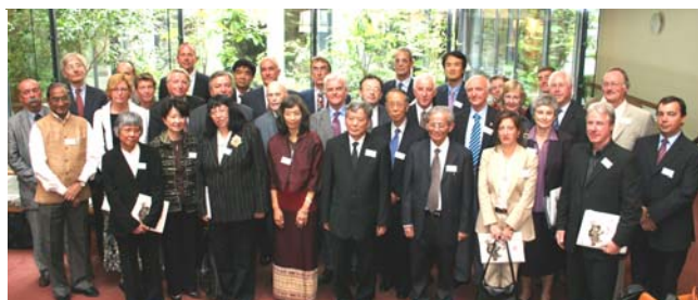
Les membres fondateurs de l'ECAF

La cérémonie de signature de l'accord multilatéral du Consortium européen pour la recherche sur le terrain en Asie, European Consortium for Asian Field study (ECAF), s'est tenue le lundi 3 septembre sous le haut patronage de l'Académie des Inscriptions et Belles-lettres, en présence du Secrétaire perpétuel et de divers représentants de pays d'Asie et d'Europe. Une initiative de l'École française d'Extrême-Orient (EFEO), le Consortium a pour objectif d'accroître l'accès au terrain en Asie pour les chercheurs et étudiants d'une trentaine d'institutions scientifiques de premier plan de huit pays européens : archéologues, conservateurs, ethnologues, historiens, y compris de l'art et des religions, linguistes, sociologues. Le groupement s'appuie sur le réseau existant des dix-sept centres de l'EFEO dans douze pays d'Asie, de l'Inde au Japon, et dont les premières implantations remontent à 1898 avec Saïgon, Hanoi, Angkor. Les bénéfices pour la France seront un rayonnement accru de la recherche française en Europe et en Asie, une diffusion plus large des travaux scientifiques, un développement de la coopération internationale, un renforcement des ressources et une mutualisation des coûts d'accès au terrain. Élargir le vivier de spécialistes susceptibles de travailler dans les centres de l'EFEO en Asie ouvre de nouvelles possibilités pour construire des projets euro-asiatiques de grande envergure pilotés par la France.