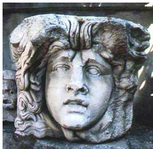
Méduse : console des thermes d'Hadrien à Aphrodisias (Musée archéologique d'Izmir)