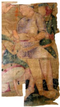
Deux dignitaires d'une peinture kouchane sur soie

Pour plus de détail > http://www.aibl.fr/fr/public/home.html (rubrique catalogue/CRAI)