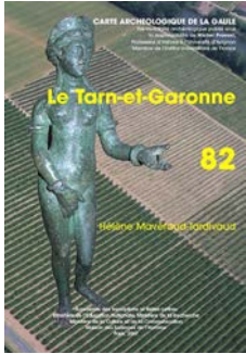
Vénus en bronze provenant du vicus de Cosa (musée Ingres, MI A 002) sur fond de voie romaine à Varènes

Carte archéologique de la Gaule , sous la direction scientifique de Michel Provost