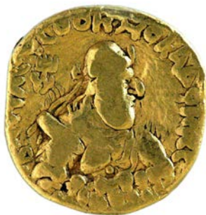
Statère de Wima Kadphisès Trésor de Pipal Mandi (note d'information d'O. Bopearachchi).