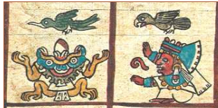
Détails du texte de la pyramide de Pépy I er à Saqqarah et du Codex Borbonicus de la Bibliothèque de l'Assemblée nationale (Paris).

> www.aibl.fr/fr/seance/home.html (rubrique Événements)