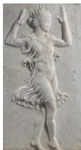
Base de candélabre du Louvre, face B. Danseuse de calathiscos , détail. Article de H. LAVAGNE.