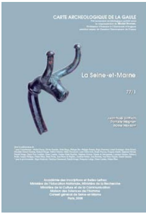
Varennes-sur-Seine, Tête de bovidé.