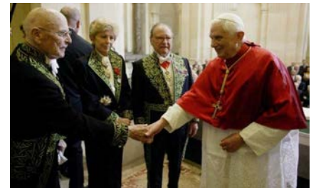
De dr. à g. Sa Sainteté le Pape Benoît XVI, le Chancelier de l'Institut, M. Gabriel DE BROGLIE, M me Hélène CARRÈRE D'ENCAUSSE, Secrétaire perpétuel de l'Académie française, et M. Jean LECLANT, Secrétaire perpétuel de l'Académie des Inscriptions et Belles-Lettres.