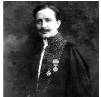
Paul PELLIOU, en habit d'académicien.