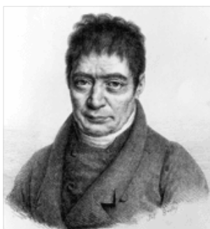
A.-J. SILVESTRE de SACY, lithographie