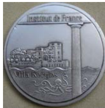
Médaille du centenaire...