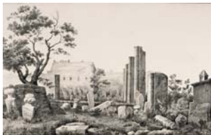
Vue de l'agora occupée par un cimetière turc ; à droite, les pilastres de la basilique, ibid. , 1867, II, pl. XII. BNF, estampes (cl. BNF).