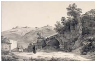
Vue du théâtre romain de Smyrne (1843), in Étienne Rey, Voyage pittoresque en Grèce et dans le Levant fait en 1843-44 , Lyon, 1867, II, pl. XI. BNF, estampes.