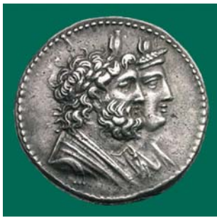
Tétradrachme d'Alexandrie de Ptolémée IV Philopator (revers) ; bustes accolés de Sérapis et d'Isis.