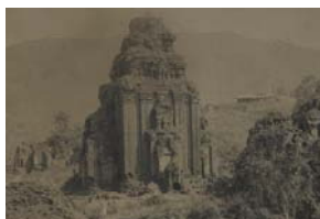
Mý Son, sanctuaire A1, face sud (ph. Charles Carpeaux, 1904, tirage d'après une vue stéréoscopique sur plaque de verre, Archives photographiques du musée Guimet, carton n° 32).