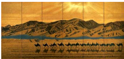
Grand ciel au-dessus de la route de la soie, par Ikuo. Hirayama, 1982.

M. Ikuo Hirayama, élu correspondant étranger de l'AIBL le 19 février 1999, est décédé à Tokyo le 2 décembre 2009, à l'âge de 79 ans. Spécialiste de la transmission du bouddhisme en Asie dans ses expressions textuelles et artistiques, le professeur Hirayama avait occupé, à deux reprises, la charge de recteur de l'Université des Beaux-Arts et de Musique de Tokyo (en 1989-1995, puis en 2001-2005). Peintre reconnu de tradition nihonga , attaché notamment aux sujets d'inspiration bouddhique, c'était une personnalité culturelle majeure dans son pays, où ses initiatives et ses fondations ont fait beaucoup pour la promotion du patrimoine national.