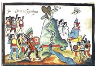
Chapultepec. Extrait du catalogue de l'Académie des Inscriptions et Belles-Lettres. Druck-u. Verlagsanstalt, Graz, Austria.