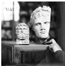
Émile Espérandieu procédant à une prise de vue (RBR 03-2615, plaque numérisée, centre Camille-Julian, Aix-en-Provence).

Fascicule 2007/4 (novembre-décembre), 523 p., 127 ill., janvier 2010 — Diff. De Boccard, 11 rue de Médicis 75006 Paris — tél. 01 43 26 00 37. Abonnement : l'année 2007 en 4 fascicules : 130 €