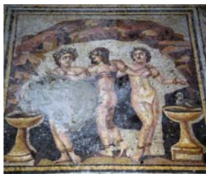
Shahba-Philippopolis (Syrie), mosaïque des Trois Grâces, panneau central.