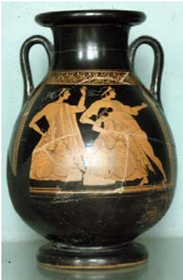
Peliké attique à figures rouges (musée du Louvre, G 65, Cp 709).