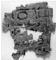
Fragment de papyrus en démotique ancien de Saqqarah (contrat).