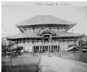
Édifice du Grand Bouddha du temple Tōdaiji (Nara, 1877). Collection Louis Kreitmann, Institut des Hautes Études japonaises du Collège de France.