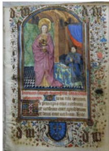
Livres d'Heures d'Hugues de Clugny.