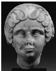
Toulouse, musée Saint-Raymond : tête de Maximilla (?).