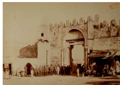
Kairouan, la porte de Tunis (in O. Houdas et al., Kairouan, 1882).