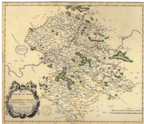
Carte du diocèse de Meaux, par Nicolas Sanson, s. d. [2e moitié du XVIIe siècle]