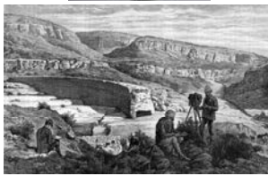
De haut en bas : Dionysos naviguant sur le navire des pirates tyrrhéniens, médaillon central de la chambre de Th. Reinach ; la nymphe Arethousa, tétradrachme de Syracuse ; Callium / Kasserine, barrage sur l'oued ed-Darb, d'après H. Saladin, Le Tour du monde , 1886.