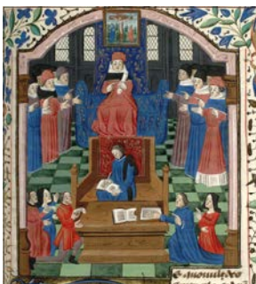
Bibliothèque Mazarine, manuscrit Ms 1331, Distinctiones in libros primum et secundum Decretalium , par Henri Bohic, 1339, f. 121 r .

Les jeudi 20 et vendredi 21 septembre 2012 (grande salle des séances de l'Institut de France)