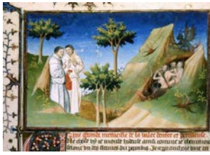
En haut : entrée de l'Enfer, Paris, BNF, fr. 2810, fol. 115 ; en bas : le temple de Ptah à Gerf Hussein, photographié par Francis Frith dans les années 1850-1870 (Victoria and Albert Museum, E. 208).