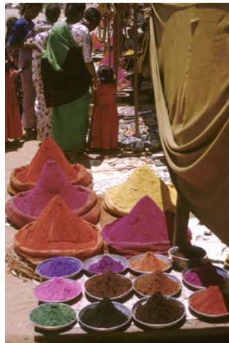
Couleurs du bon augure, marché de Mysore, sud de l'Inde © R. & S. Michaud / akj-images.