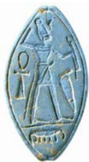
Le « smiting god » cananéen. Perle en matière vitreuse (RS 3.113).

Alors que s'achevait l'édition du volume des actes de ce colloque, qui s'était tenu les 2 et 3 décembre 2010 au Collège de France, puis à l'Académie, l'équipe en charge de sa confection a été endeuillée par la brusque disparition de Pierre Bordreuil, le grand spécialiste des études ougaritiques, à la mémoire duquel l'Académie souhaite rendre hommage.