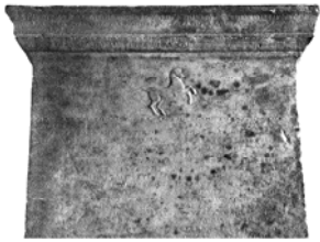
Stèle des Géléontes.