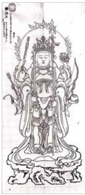
Benzaiten, divinité aquatique et déesse des arts

Fascicule 2013/3 (juillet-octobre), 309 p., 80 ill., fin février 2015 Diff. De Boccard, 11 rue de Médicis 75006 Paris tél. 01 43 26 00 37 ; courriel : info@deboccard.com . Abonnement : l'année 2013 en 4 fascicules : 150 .