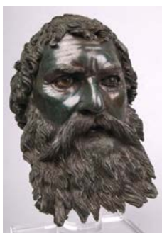
Tête de Seuthès III. Sofia, Institut national d'archéologie et musée, Académie Bulgare des sciences. inv. n° 8594.