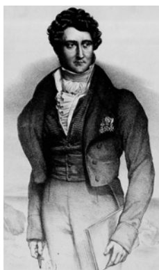
Portrait de Louis-Auguste de Forbin. Extrait du Portefeuille du comte de Forbin , 1843.