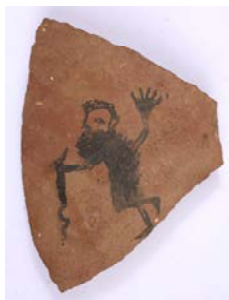
Ostracon orné d'une représentation de Moïse, Umm Balad (Domitienne), Égypte, vers 100 ap. J.-C. (O.Ka.La. inv. 179,).