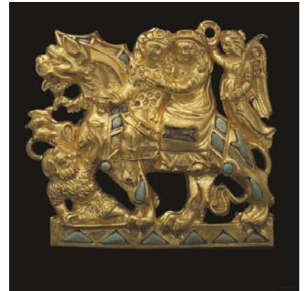
Dionysos et Ariane chevauchant un griffon. Bactriane (Afghanistan). I er siècle ap. J.-C.