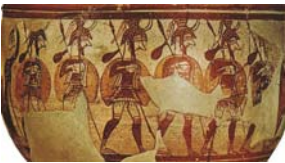
Le vase aux guerriers de Mycènes. Vers 1200 av. J.-C. Athènes, Musée national, inv. 1426.