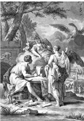
Polybe rédigeant son Histoire romaine sur les enseignements de Minerve et de Clio, Traité de la Colonne du chevalier de Folard, p. 1, 1715.