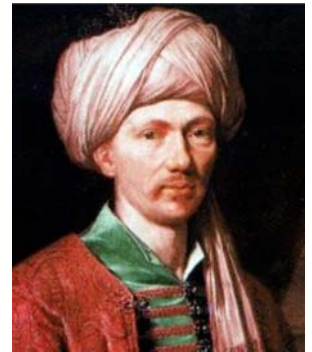
Philippe de Champaigne, Portrait présumé d'Antoine Galland.

Antoine Galland (1646-AIBL 1706-1715) a ouvert une porte royale sur l'Orient par les connaissances qu'il a acquises au cours de ses voyages dans l'Empire ottoman, par sa collecte de médailles et de manuscrits, ses travaux savants, son érudition et son talent d'écrivain dans la belle langue du tournant de 1700. Ses récits de voyage éclairé, son Discours-Préface de la Bibliothèque orientale de d'Herbelot en 1694, les Mille et une nuits publiées de 1704 à 1717, les Paroles remarquables , sans oublier De l'origine et des progrès du café , toute son œuvre engage le XVIII e siècle dans la découverte de la réalité des mondes arabe, turc et persan, puis fraye la voie vers une Asie plus lointaine.