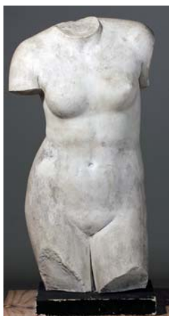
Moulage d'un torse original d'Aphrodite en marbre, copie de ENSBA, MU 7763. Dresde, Staatliche Kunstsammlungen, n° inv. ASN 2373.