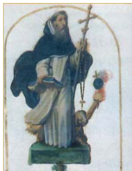
Saint Dominique. Douai, Bibl. Mun. ms. 1170, f. 86 (XVII e s.).

Pour en savoir plus sur l'intégralité du programme de ce colloque et le télécharger > www.aibl.fr (rubrique « Séances et manifestations > Colloques et journées d'études > Colloques et journées d'études 2015 »).