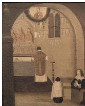
La chapelle Sainte-Anne dans la cathédrale d'Apt, ex-voto de 1642 (Cl. Musée d'Apt).