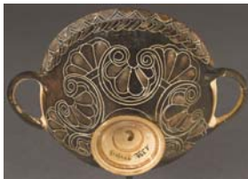
Coupe de Vroulia. Louvre, A 332, extérieur © RMN-Grand Palais (musée du Louvre) / Hervé Lewandowski.