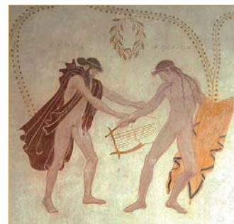
Dispute de la lyre entre Hermès et Apollon, péristyle de la Villa Kérylos.