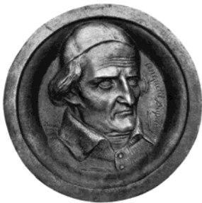
Portrait posthume d'Anquetil Duperron, médaille de David d'Angers, musée d'Angers.

M. Robert TURCAN, membre de l'Académie, a publié récemment Recherches mithriaques. Quarante ans de questions et d'investigations (Paris, Les Belles Lettres, 2016, 517 p. in-8°, 62 illustrations). Ce riche volume réunit plusieurs articles et communications, outre deux contributions inédites sur le dieu au serpent et l'échelle mithriaque.