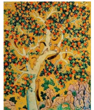
Art mogol : Abū'l Hasan & Mansūr, Platane et écureuils , 1610.

L'arbre est un familier de la vie quotidienne. Il n'y a pas de vie où il n'y a pas d'arbres. Sa ramification est le symbole de la croissance. L'arbre est un bienfaiteur et un symbole de la bienfaisance. « De même que le roi des arbres de médecine guérit tous les malades qui en prennent la racine, le tronc, les branches, les feuilles, les fleurs, les fruits ou l'écorce, de même le Bodhisattva forme le vœu : qu'en entendant ma voix, en touchant mon corps, en absorbant mon sang, ma chair, mes os, ma moelle, tous les malades guérissent » ( Mahāparinirvāṇasūtra ). L'arbre mérite la gratitude, l'affection des hommes. Il est un objet de culte dans toute civilisation. L'arbre dans la religion, dans les beaux-arts, en littérature, en philosophie, les vocabulaires de noms d'arbre, la médecine des arbres, l'art forestier, l'art des jardins, l'arbre est au centre de l'écologie naturelle, de l'imagination artistique et littéraire, de la religion. Toutes les disciplines, toute l'Asie sont concernées par le thème de l'arbre.