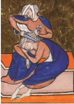
Psautier de Saint Louis, Paris, vers 1260-1265 (Paris, BNF, ms. lat. 10.525), fol. 61 v°, Samson et Dalila.