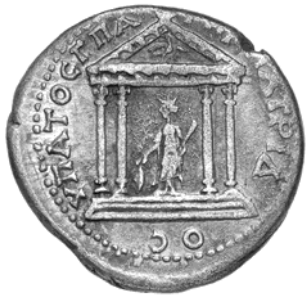
Hiérapolis Comana, 128-138, tridrachme. Berlin collection Löbbecke.