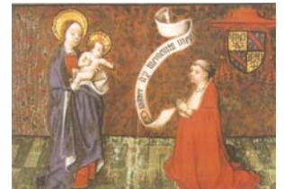
L'Imago mundi. Cambrai, Bibl. mun., ms 954, f. 1 ra.