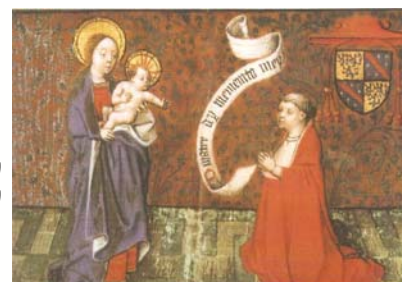
L'Imago mundi. Cambrai, Bibl. mun., ms 954, f. 1 ra.