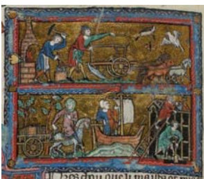
Brunet Latin, Li Livre dou tresor , BnF, fr. 751, fol. 66 v°.

Pour en savoir davantage sur le programme des célébrations de l'EPHE > http://www.ephe.fr/actualites/ephe_programme_des_conferences_et_enseignements_2015-2016/ephe-programme-des-enseignements-2015-2016.pdf .