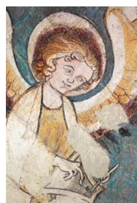
Voûtain sud de la chapelle des Apôtres à la cathédrale de Poitiers : ange musicien.