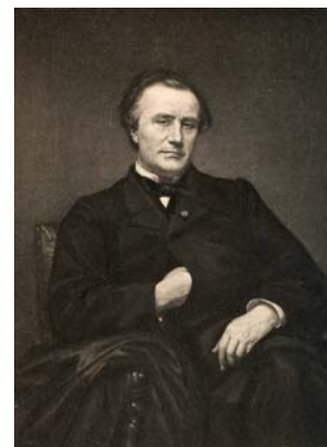
Victor Duruy, 1869 par Nélie Jacquemart (coll. musée Jacquemart-André, Institut de France). Photo extraite de Notes et souvenirs (1811-1894), t. I, Paris, 1901.

La séance de l'Académie du vendredi 28 septembre 2018 s'inscrit dans le cadre des célébrations du cent-cinquantième de l'EPHE avec laquelle l'Académie entretient depuis les origines des liens particulièrement étroits, de nature à la fois statutaire et scientifique, et au sein de laquelle nombre de ses membres et correspondants ont occupé au cours de leur carrière des chaires dans ses sections des sciences historiques et philologiques ainsi que des sciences religieuses. Occasion sera fournie non seulement de présenter le contexte dans lequel la conception de « hautes études » vit le jour, en dressant le tableau de la situation de l'enseignement supérieur en France à la fin du Second Empire, mais également de rendre hommage à la figure et à l'œuvre de l'historien Victor Duruy, qui créa l'EPHE selon un esprit particulièrement novateur pour son temps, en vue de promouvoir, dans le cadre de séminaires de haut niveau, l'« apprentissage de la recherche par la pratique de la recherche », répondant ainsi à la double vocation de conservatoire et de laboratoire que ce grand établissement partage avec l'Académie.