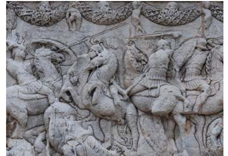
Mausolée de Glanum, scène avec cavaliers (30/20 av. J.-C.).