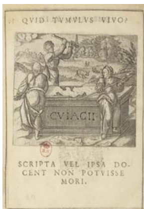
Bibliothèque nationale de France, département Littérature et art, Z-3537 (numérisé sur Gallica).