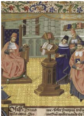
Médecin enseignant à des étudiants. A ses côtés se tiennent Galien, Avicenne et Hippocrate. Mss latin BNF 6966 (daté de 1461).

Jacques Cujas reste encore aujourd'hui l'un des plus célèbres juristes français, bien que son œuvre demeure trop largement méconnue. Né à Toulouse en 1522, il poursuit une riche et itinérante carrière de professeur de droit romain. Après avoir effectué l'intégralité de ses études dans sa ville natale, il est docteur-régent à Cahors (1554-1555), Bourges (1555-1557, 1559-1566 et 1575-1590), Valence (1558-1559 et 1567-1575) et Turin (1566-1567), et enseigne brièvement à Paris en 1576. Au cours de cette carrière ascensionnelle (qui s'achève par sa mort à Bourges le 4 octobre 1590), Cujas publie de nombreux ouvrages qui lui confèrent une très grande renommée et attirent à lui la foule des étudiants. Cette gloire est principalement due à la compréhension renouvelée des textes de droit romain résultant de l'application des savoirs humanistes à l'étude du droit. Figure de la Renaissance, Jacques Cujas apparaît, plus particulièrement, comme le principal représentant de la méthode historique au sein du courant de l'humanisme juridique.