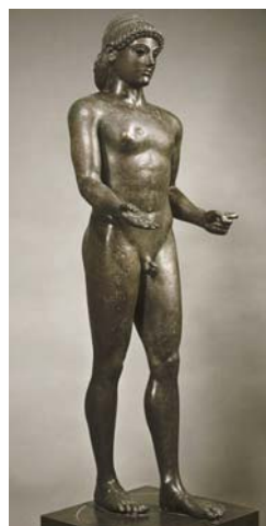
« L'Apollon de Piombino », vu de trois-quarts (musée du Louvre, Br 2.).