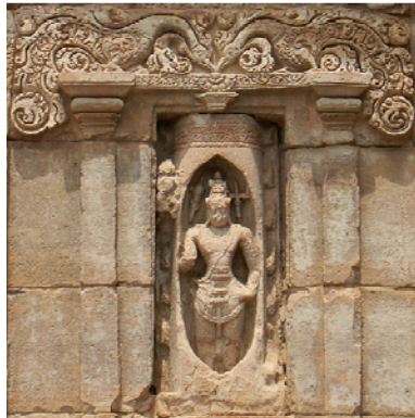
Mythe indien d'origine, Pattadakal, Lingodbhavamurti , VIII e s. ap. J.-C.

Retrouvez la Lettre d'information de l'AIBL, téléchargeable au format pdf sur www.aibl.fr .