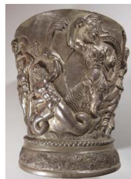
Vase en argent de la collection Al Thani : Athéna et un géant anguipède.