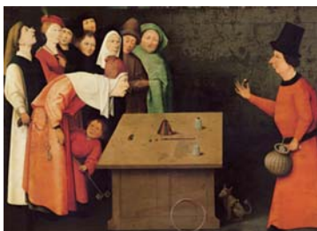
© Jérôme Bosch, L'Escamoteur (1475-1506 ?), musée municipal de Saint-Germain-en-Laye.

Pour en savoir plus sur l'intégralité du programme de ces journées d'études internationales, ses organisateurs et ses partenaires > http://www.aibl.fr/seances-et-manifestations/colloques-et-journees-d-etudes .