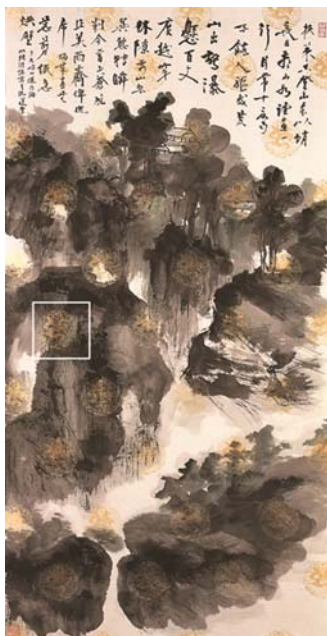
JAO Tsung-I, Tempête de pluie sur l'île de Lantau