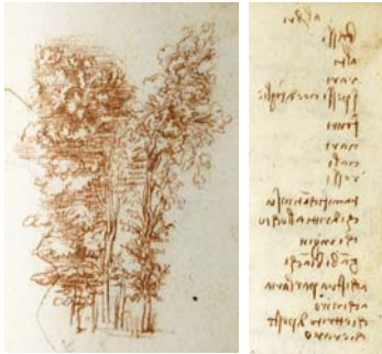
Léonard de Vinci, ms L, fol. 81 v o et 87 v o .

Jeudi 4 avril (Maison de l'Italie, Cité internationale universitaire de Paris, Paris XIV e ) Vendredi 5 avril (AIBL, grande salle des séances)