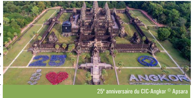
25 e anniversaire du CIC-Angkor

Séance organisée, sous le haut patronage de Sa Majesté NORODOM Sihamoni, Roi du Cambodge, associé étranger de l'AIBL dans le cadre de la célébration de « 25 ans de contributions cambodgienne, française et internationale à la conservation et au développement d'Angkor, patrimoine culturel de l'humanité (UNESCO) »