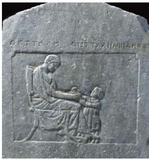
Détail de la stèle funéraire à relief pour Thettalè et sa fille homonyme. Musée d'Érétrie (inv. 20064).