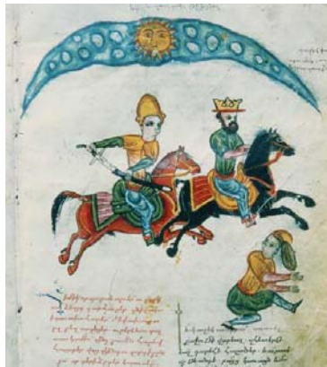
Alexandre poursuivant Darius III en fuite, Roman d'Alexandre , ms Érévan (Maténadaran n° 5472, f° 83).

La plupart des pouvoirs établis dans le monde asiatique depuis l'Antiquité ont élaboré une idéologie centrée autour de la personne du roi. Celle-ci avait pour fonction de fonder sa légitimité, d'expliquer et de justifier son rôle tant dans l'organisation de la société que dans les rapports de celle-ci avec le monde céleste. Cette idéologie royale se manifestait sous des formes multiples, écrites ou figurées qui, si elles entretenaient bien souvent des liens avec le divin, étaient avant tout des moyens d'assurer la