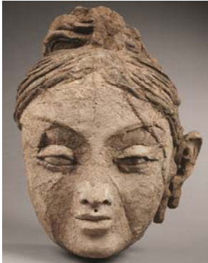
En haut : le dieu Cernunnos, pilier des Nautes, musée de Cluny ; en bas : monastère bouddhique d'Adjina Tepa, tête féminine de la cour du stûpa.