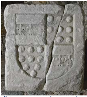
Caisson aux armes du commandeur Quirini provenant de l'une des courtines de Leros.