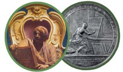
Allégorie de l'École des chartes par J.-J. Benjamin-Constant (grand salon du rectorat à la Sorbonne) ; médaille commémorant l'institution de l'Académie, 1700.

Le vendredi 24 septembre l'Académie célébrera solennellement sous la Coupole du palais de l'Institut le bicentenaire de l'École nationale des chartes à la création de laquelle elle fut étroitement associée en 1821 et sur laquelle elle exerce depuis lors un rôle de tutelle. Le programme de cette séance ouverte par une allocution d'accueil du Secrétaire perpétuel Michel ZINK sera le suivant :