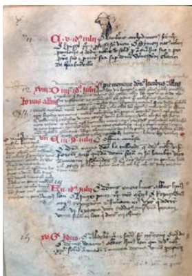
Le second nécrologe de Saint-Airy, V id. jul.-Idus (11-15 juillet). Verdun, BM, ms. 11, f. 170v.