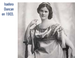
Isadora Duncan en 1903.