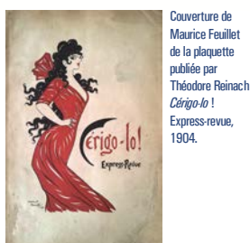
Couverture de Maurice Feuillet de la plaquette publiée par Théodore Reinach Cérigo-lo! Express-revue, 1904.

En sa séance du vendredi 5 juillet 2013, la commission du Prix Garnier-Lestamy a décidé de couronner l'association « Les Amis de Saint-Jacques-Couvent Saint-Jacques » pour aider les travaux de réaménagement qu'elle a décidé d'accomplir, notamment dans l'espace de célébration de l'église conventuelle de la rue de la Tannerie à Paris.