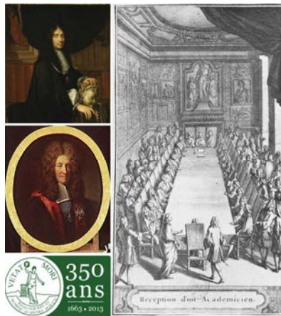
A g., en haut : portrait de Charles Perrault ; en bas : Louis de Pontchartrain ; à dr. : gravure de F. Delamonce d'après N. de Poilly, Réception d'un Académicien .

Retrouvez la Lettre d'information de l'AIBL sur son site internet : www.aibl.fr . Téléchargeable au format pdf, à partir de son n° 42, sa consultation est facilitée grâce à une table des matières intégrée.