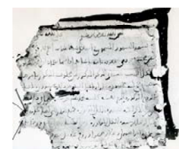
Certificat de partage au moment d'une séparation.