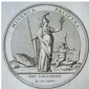
La paix avec la Savoie (n° 265), ms bibliothèque de l'Institut.