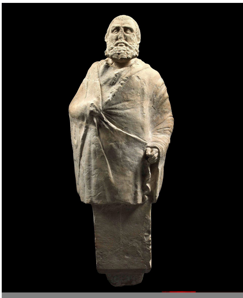
« Ai Khanoum, pilier hermaïque du gymnase. Musée national d'Afghanistan, Kaboul (MK 05.42.14). ».

L'Académie des Inscriptions et Belles-Lettres et la Délégation archéologique française en Afghanistan (Dafa), organisent un colloque international pour commémorer le centenaire de cette institution scientifique. Fondée par Alfred Foucher en 1922 et soutenue par le Ministère des Affaires Étrangères depuis ses débuts, la Dafa, bien que parfois soumise aux aléas de la situation politique de l'Afghanistan, a pu apporter une contribution majeure à la découverte, la connaissance et la préservation du patrimoine de ce pays. Son bilan scientifique est remarquable. Grâce à de nombreuses fouilles conduites dans plusieurs régions, elle a fait progresser les connaissances sur toutes les époques, de l'âge du bronze à la période médiévale islamique, tout aussi bien que sur les royaumes gréco-bactriens et l'empire kouchan. Histoire, art, textes, monuments et objets ont fait l'objet d'études précises et de très nombreuses publications savantes, dont les trente-quatre volumes parus des Mémoires de la Délégation Archéologique Française en Afghanistan . Ce colloque est l'occasion de montrer aussi comment les thèmes abordés et les approches pratiquées ont évolué au cours de ce siècle.